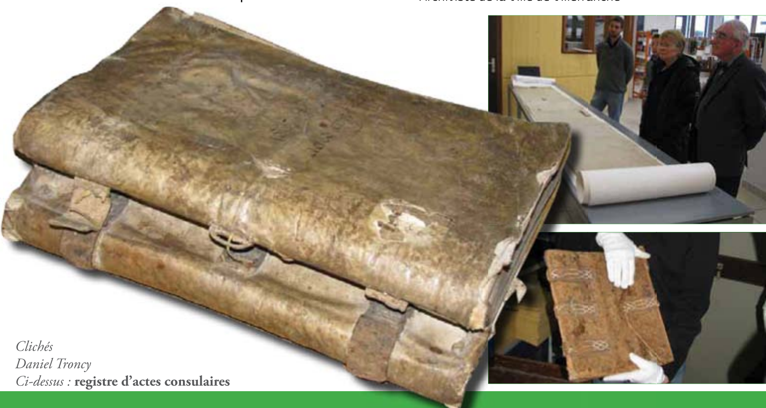
Ci-dessus : registre d'actes consulaires